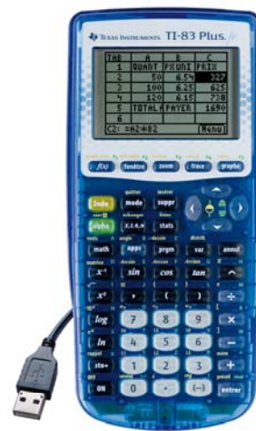
TI-83 Plus.fr 3243480100489