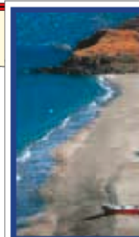
LES ÎLES DU NORD-EST DE LA MER ÉGÉE Pages 124-157