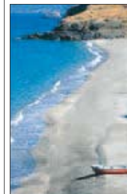
Plage de Kámpos à Ikaría (nord-est de la mer Égée)

SÉJOURS À THÈME ET ACTIVITÉS DE PLEIN AIR 344