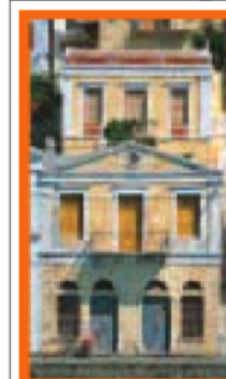
LE DODÉCANÈSE Pages 158-203