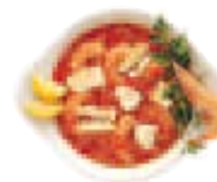
Un plat de garides saganaki