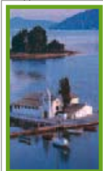
LES ÎLES IONIENNES Pages 68-91