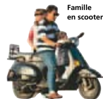
Famille en scooter