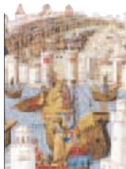
Arrivée du prince ottoman Djem à Rhodes (xve siècle)