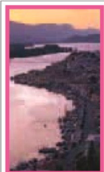
LES ÎLES ARGO- SARONIQUES Pages 92-103