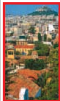
VISITE D'ATHÈNES Pages 282-295