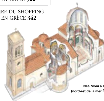
Née Moni à Chios (nord-est de la mer Égée)

SÉJOURS À THÈME ET ACTIVITÉS DE PLEIN AIR 344