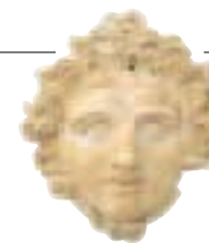
Tête de Gorgone, Evvoia