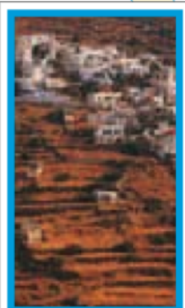
LES CYCLADES Pages 204-243