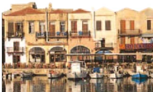
Le port de Réthymno (Crète)

Aussi soigneusement qu'il ait été établi, ce guide n'est pas à l'abri des changements de dernière heure. Faites-nous part de vos remarques par e-mail à l'adresse suivante : voir@hachette-livre.fr