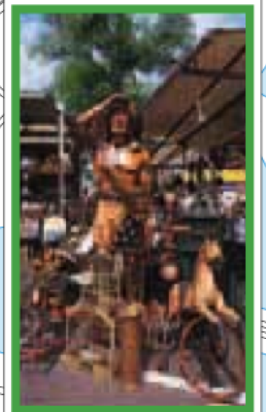
OUDE ZIJDE Pages 56-69