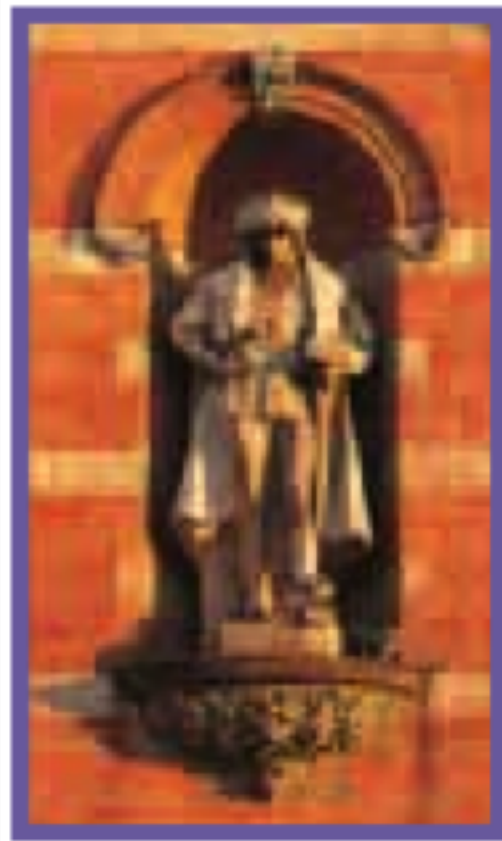
LE QUARTIER DES MUSÉES Pages 124-137