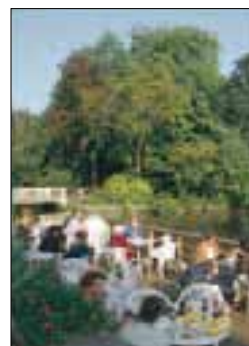
Au parc zoologique Artis