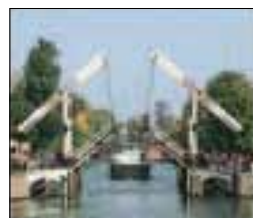
Le Magere Brug, emblématique pont basculant de la ville