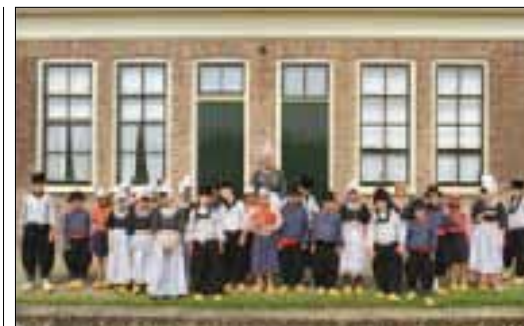
Enfants en costumes traditionnels devant une église au Zuiderzee museum