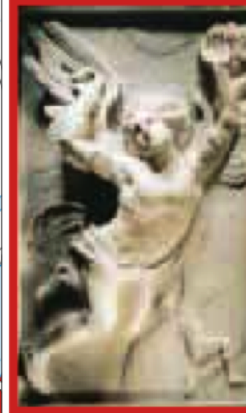
NIEUWE ZIJDE Pages 70-85