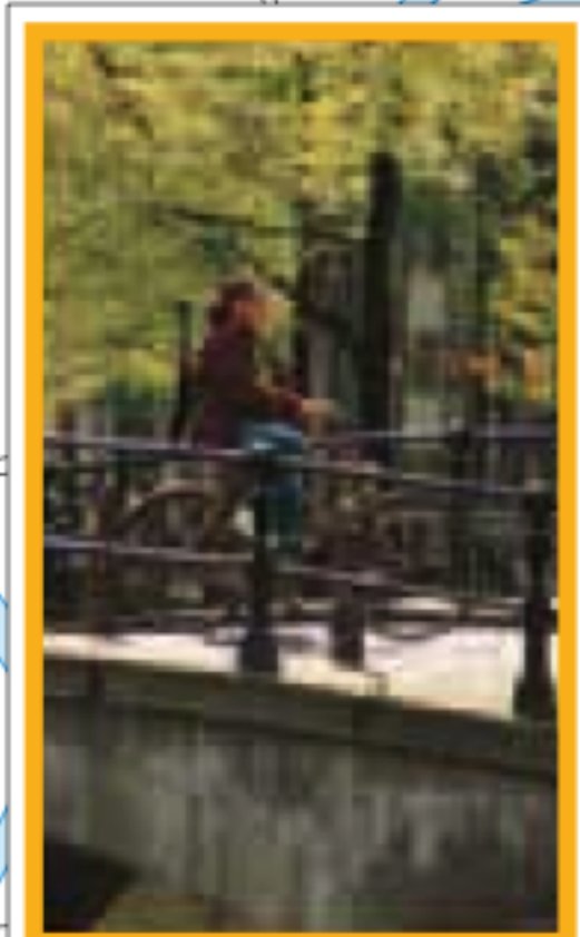
DU BIJBELS MUSEUM À LEIDSEPLEIN Pages 106-113