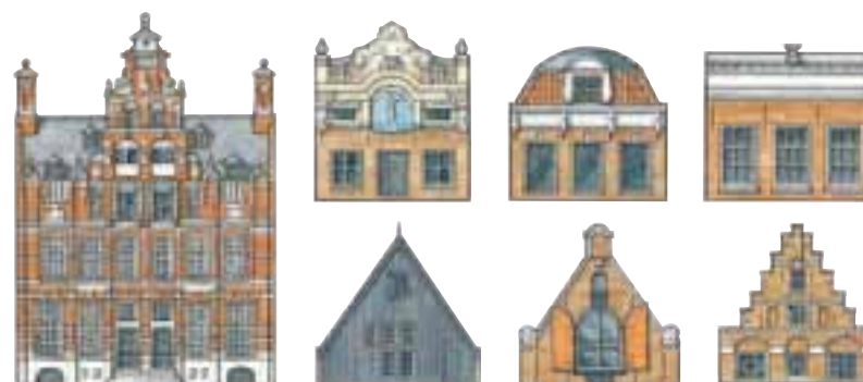
Maison de style Renaissance hollandaise et détails de corniches et de pignons