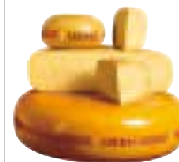
Roues de gouda