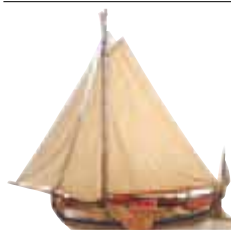
Maquette au Scheepvaart museum