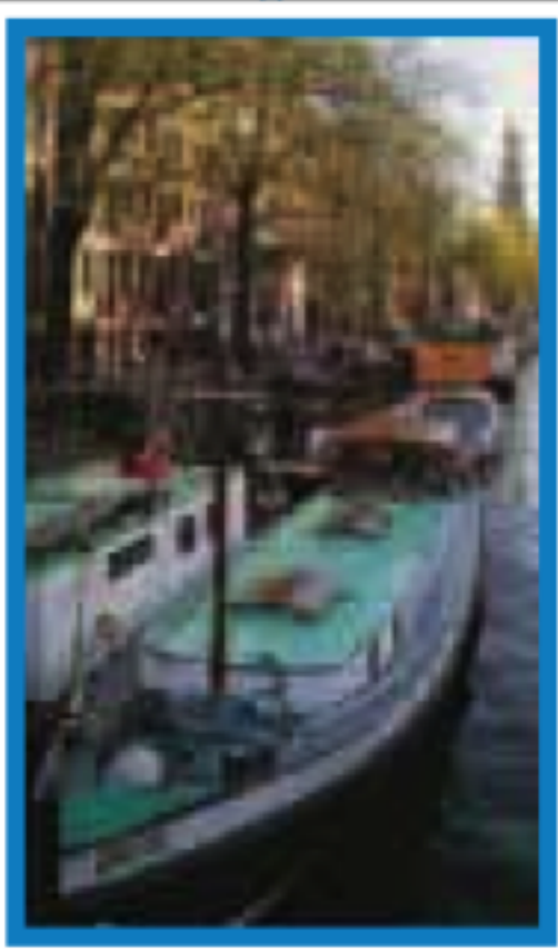
LE JORDAAN Pages 86-93