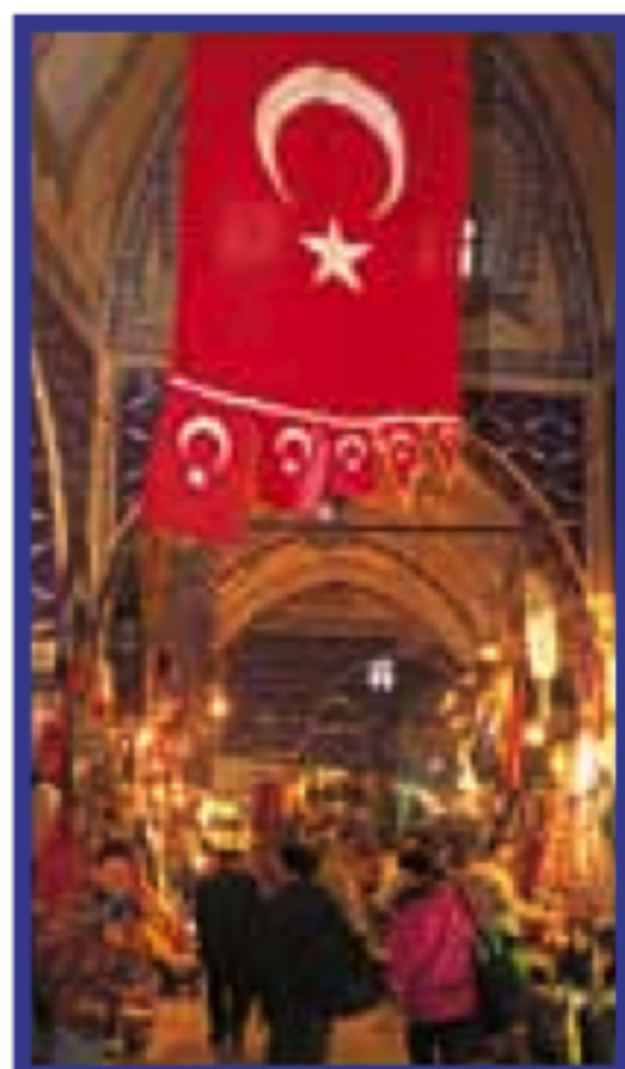
QUARTIER DU BAZAR Pages 84-99