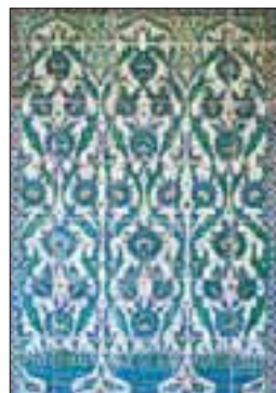
Mosaïque du salon des Princes, harem de Topkapı