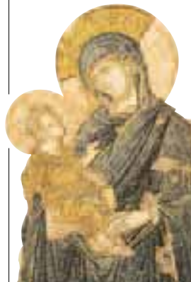
Mosaïque de la Vierge, église Saint-Sauveur-in-Chora