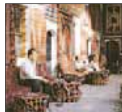
Fumeurs de narguile dans la cour de Çorulu Ali Paşa