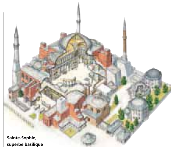
Sainte-Sophie, superbe basilique byzantine du V e siècle