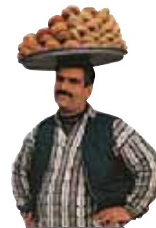
Vendeur de simit