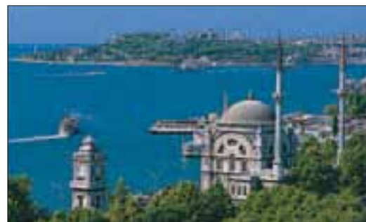
La mosquée de Dolmabahçe devant le Bosphore et Sultanahmet