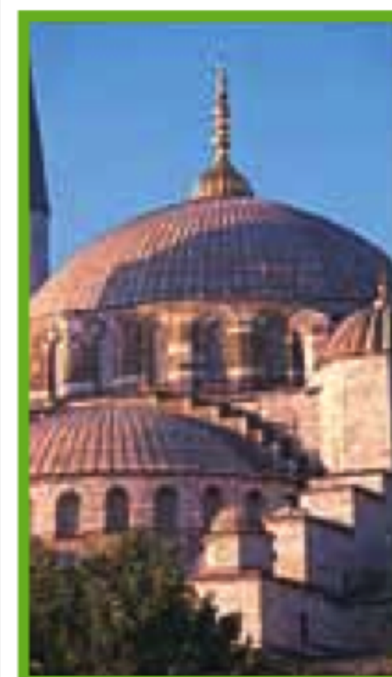
SULTANAHMET Pages 68-83