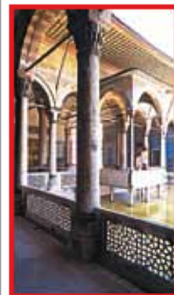
POINTE DU SÉRAIL Pages 50-67