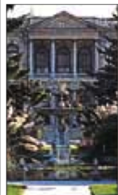
GRAND ISTANBUL Pages 108-133

La carte ci-dessous montre les quatre quartiers centraux d'Istanbul qui renferment la majorité des sites décrits dans ce guide. Les autres sites sont présentés dans les chapitres consacrés au Grand Istanbul, au Bosphore et aux excursions hors de la ville. Les principaux quartiers de visite possèdent chacun un code de couleur (repris sur le premier rabat de couverture). Un onglet de couleur en haut des pages permet de trouver rapidement celles qui leur sont consacrées.