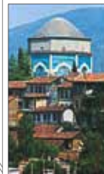
EXCURSIONS Pages 150-171