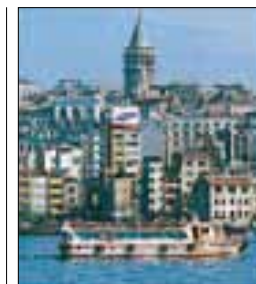
Ferry longeant Karaköy