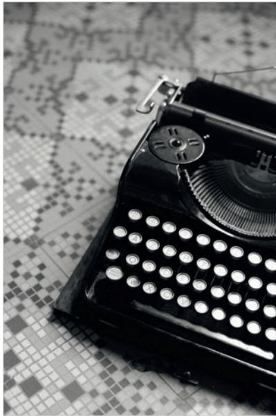
Bichromie réalisée à partir d'une encre noire et d'une encre chaude Pantone Warm Gray 3 C.

Comme son nom l'indique, l'impression en trichromie permet de combiner trois encres. De même que la bichromie, elle est conseillée pour la reproduction des