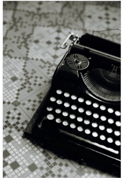
Trichromie réalisée en associant une encre noire à une encre bleue et une encre jaune; les courbes de chacune étant équilibrées jusqu'à obtenir la teinte souhaitée.