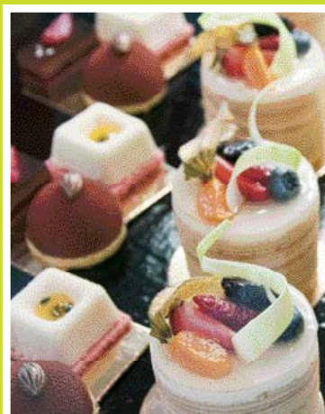
Werkstatt der Süße

Allez fouiner parmi les vêtements vintage et les meubles de seconde main.