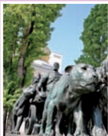
Pavillon de la Sécession

Apprenez tout sur le Jugendstil viennois dans ce bâtiment remarquable.