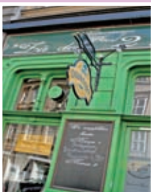
Zu den 2 Lieserln

Plongez dans l'univers exubérant du kitsch et du design.