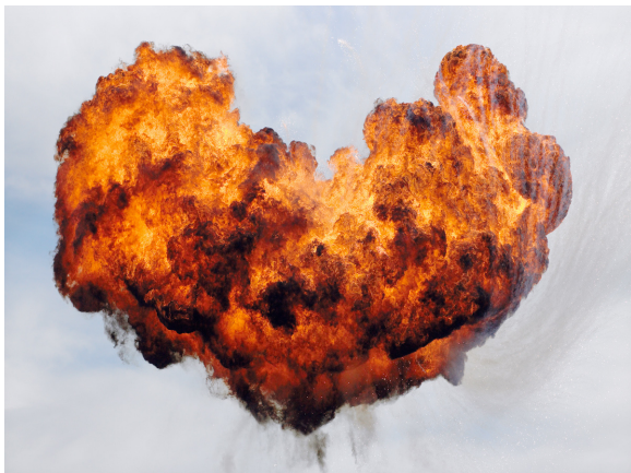
© Geoffrey H. Short « Untitled Explosion "#6CP" » 2007, from the series « towards another (big bang) theory »

> FNAC DES TERNES // lundi 17 octobre à 19h