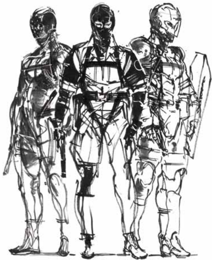
OUT OF HEAVEN