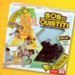
SOS Oustiti (réf. 52562)

Entre le 29 octobre et le 27 novembre 2016