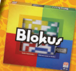
Blokus (réf. BJV44)

* Offre valable sur le moins cher des 2 - voir modalités au verso - visuels non contractuels