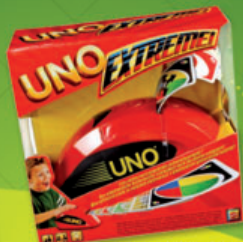
UNO Extreme (réf. Y9364)